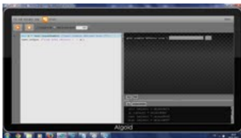
Etape 3.jpg 167K

Yann Caron <cyann74@gmail.com> À : gique meca <linitier89@gmail.com>